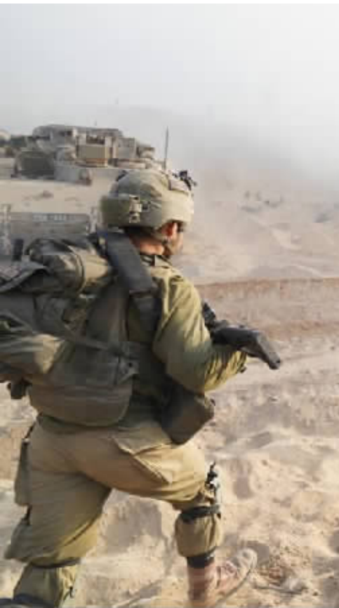
11月7日上午,以军地面部队在加沙地带内部继续进行军事行动。