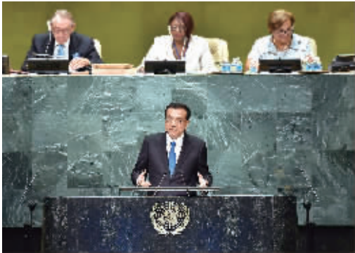
2016年9月21日，李克强同志在纽约联合国总部出席第71届联合国大会以“可持续发展目标：共同努力改造我们的世界”为主题的一般性辩论并发表题为《携手建设和平稳定可持续发展的世界》的讲话。