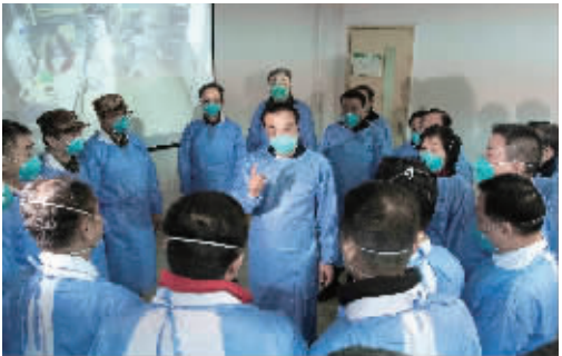
2020年1月27日，李克强同志赴湖北省武汉市考察指导疫情防控工作，代表党中央、国务院慰问疫情防控一线的医务人员。

（◀◀上接A02版）坚持以人民为中心的发展思想，着力保障和改善民生，推进精准扶贫、精准脱贫，实施积极的就业政策，坚持教育优先发展，促进城乡教育均衡发展，加快推进分级诊疗和医联体建设，建立统一的城乡居民基本养老、医疗保险制度，完善社会救助制度，加快构建社会保障安全网，人民群众获得感不断增强。坚持人与自然和谐发展，着力治理环境污染，生态文明建设取得积极进展。推动依法全面履行政府职能，落实中央八项规定精神，坚持“约法三章”，努力建设人民满意的法治政府、创新政府、廉洁政府和服务型政府。