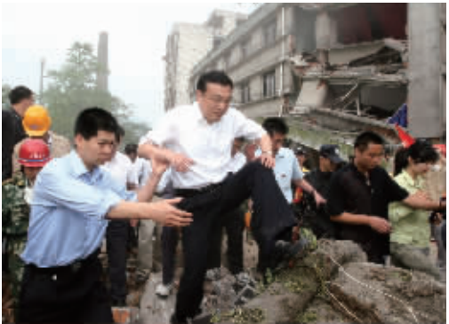
2008年5月19日，李克强同志在四川地震灾区察看灾情。