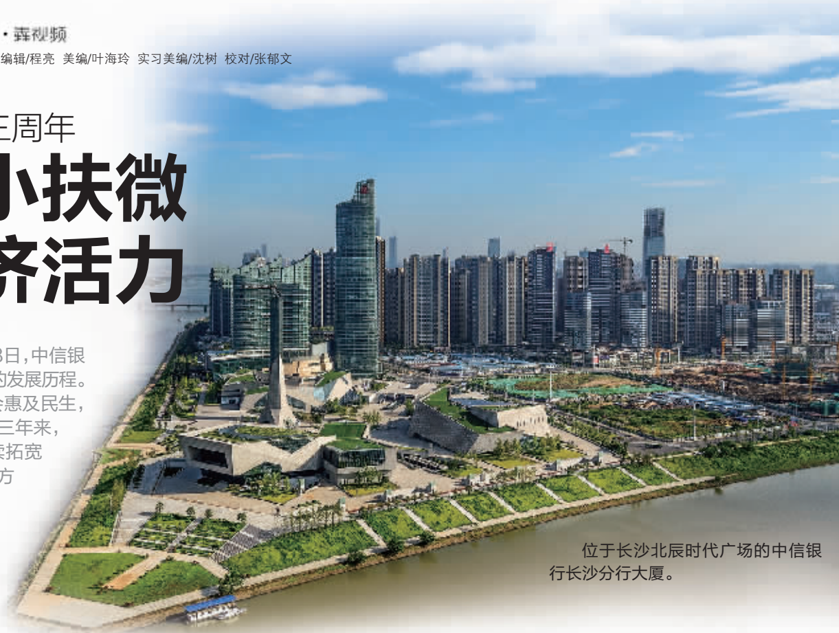
位于长沙北辰时代广场的中信银行长沙分行大厦。