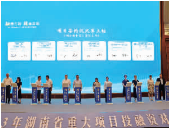
兴业银行长沙分行与金博碳素在湖南省2023年重大项目投融资对接会现场签约。

兴业银行长沙分行相关负责人介绍,该行目前服务园区内企业近万户,通过不断创新产品和服务,持续为园区内企业发展提供充足的金融活水。“商行+投行”联动支持三一集团、中联重科、中伟新材等龙头企业,增强龙头企业对产业链供应链的辐射带动作用,提升产业集聚效应。通过“技术流”评价体系创新,一改依靠抵押物等传统思维,让数据成为生产资料,支持了以飞沃科技为代表的“专精特新”科创企业发展,助力更多高精尖技术领域取得突破。