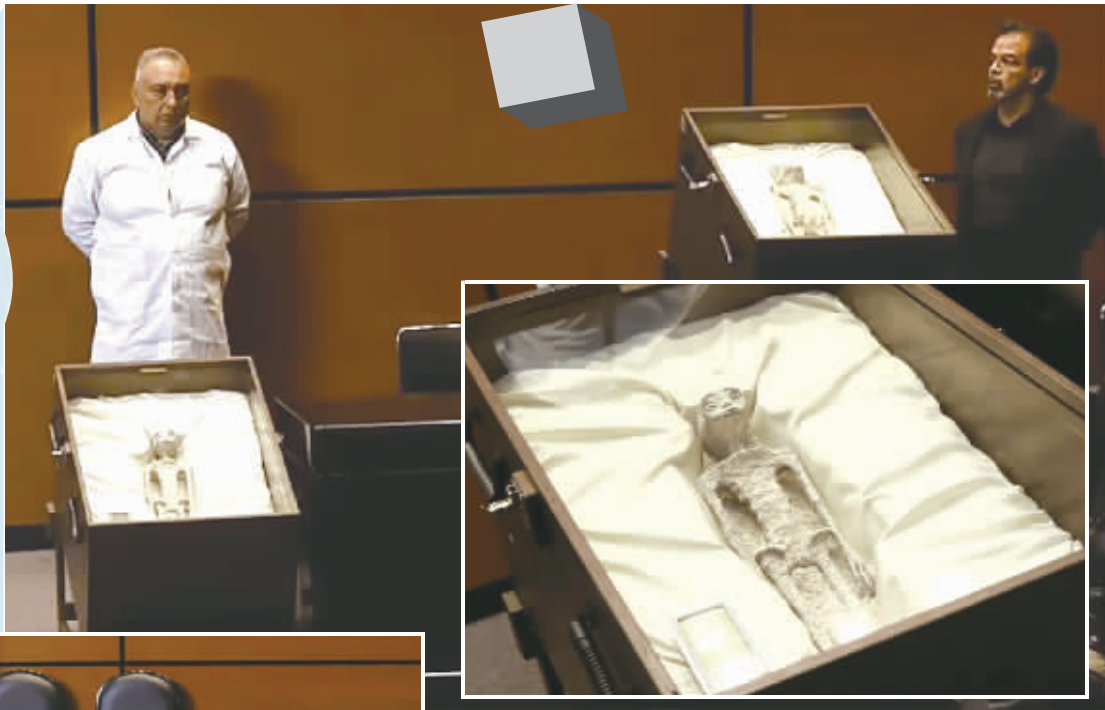
墨西哥国会听证会上展示的遗体证据。视频截图

不少科学家也质疑这两具所谓“外星人遗体”的真实性。墨西哥国立自治大学天文研究所研究员胡列塔·菲耶罗说，这两具遗体的不少细节“解释不通”。她说，科学家需要更先进的技术，而非仅凭X射线扫描，才能判断钙化的“干尸”是否“非人类”。