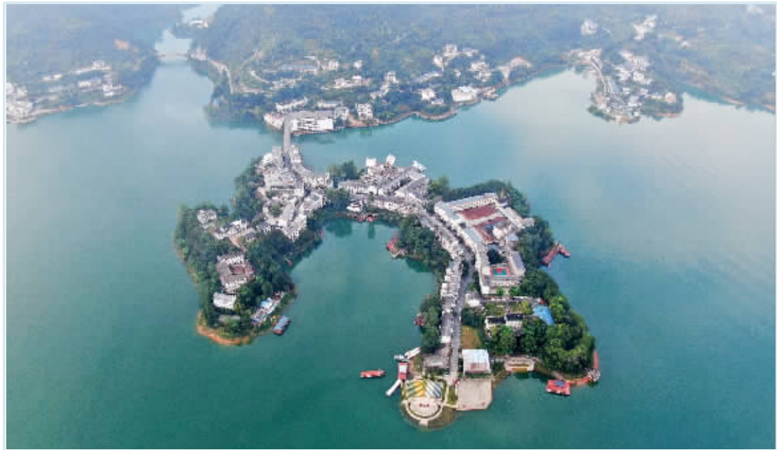
湖光小镇 8月15日,资兴市黄草镇风光秀丽,景美如画。近年来,黄草镇始终坚持走生态惠民、绿色发展之路,狠抓生态环境保护工作,做活可持续发展“水文章”,全面实施“旅游+”工程,实现全域旅游和生态环境保护双赢。