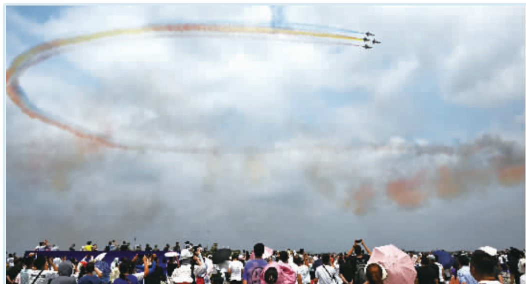
告慰先辈 激励后人 7月27日,空军航空开放活动·长春航空展首个公众日,也恰逢抗美援朝战争胜利70周年。空军八一飞行表演队特别选用红、黄、蓝三色拉烟的方式纪念这一特殊的日子,告慰先辈、激励后人。

医药卫生、文化旅游等领域合作。 习近平指出,今年是我提出建设更为紧密的中国－东盟命运共同体10周年,也是中国加入《东南亚友好合作条约》20周年。中方愿同东盟深化全面战略伙伴关系,支持印尼担任今年东盟轮值主席国,引领东盟坚持战略自主、团结自强,共同打造地区稳定中心、发展高地。中方愿同印尼加强在二十国集团和金砖国家等多边机制沟通协作,推动落实全球发展倡议、全球安全倡议、全球文明倡议,维护地区和全球和平稳定,推动构建人类命运共同体。 佐科表示,去年我在巴厘岛接待习近平主席访问以来,两国关系又取得很多实质进展。雅万高铁将于今年8月按期通车,中方积极参与的印尼新首都建设和北加里曼丹工业园开发等战略性项目进展顺利。印尼坚定奉行一个中国政策,愿同中方继续加强投资、海洋渔业、粮食安全、医疗卫生等方面合作,进一步促进两国全面战略伙伴关系发展。习近平主席提出的全球发展倡议、全球安全倡议、全球文明倡议是开放包容的,印尼积极支持。感谢中方支持印尼担任东盟轮值主席国工作,支持维护东盟在地区架构中的中心地位。印尼愿和中方密切战略沟通,共同维护地区和平稳定与发展繁荣。 会见后,两国元首共同见证签署农产品输华、卫生、联合研发以及印尼新首都、中印尼“两国双园”建设等多项双边合作文件。 蔡奇、丁薛祥、王毅、谌贻琴等参加上述活动。 ■据新华社