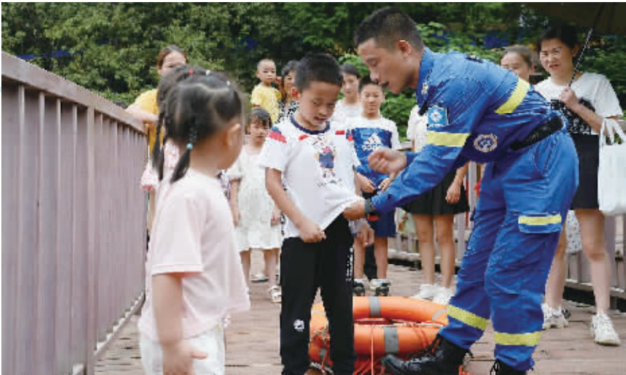
长沙县蓝天救援队的队员在教孩子们安全自救。