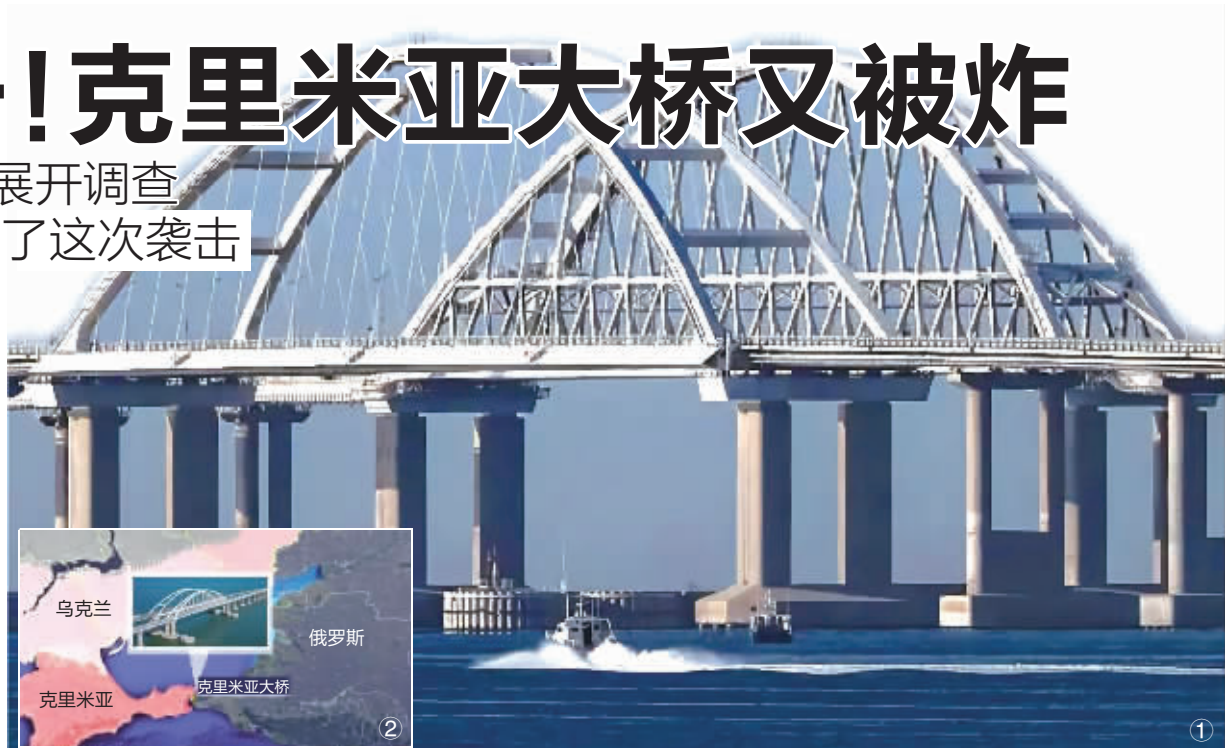
①这是7月17日拍摄的克里米亚大桥。 新华社图 ②克里米亚大桥位置图。 ③大桥被炸，靠近克里米亚半岛一侧路面遭破坏。

7月17日，连接克里米亚半岛与俄罗斯本土的克里米亚大桥传出爆炸声，造成大桥部分路面受损，交通一度中断，并造成人员伤亡。俄罗斯国家反恐委员会称，乌方出动两艘水面无人艇袭击克里米亚大桥。