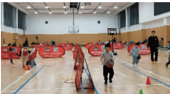
提质改造后的训练馆内景。