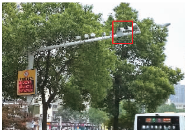
6月15日上午,长沙金星路咸嘉湖路口,禁鸣抓拍系统正在抓拍,旁边显示鸣笛车辆号牌。

6月15日开始,随着新的禁鸣通告实施,长沙公安交警同步启动机动车在禁鸣区域鸣喇叭专项整治行动,城区各勤务大队每天组织2场整治,在主次干道、学校、居民小区等机动车鸣喇叭多发区域开展整治行动。同时,运用路口机动车鸣喇叭抓拍设备进行执法。