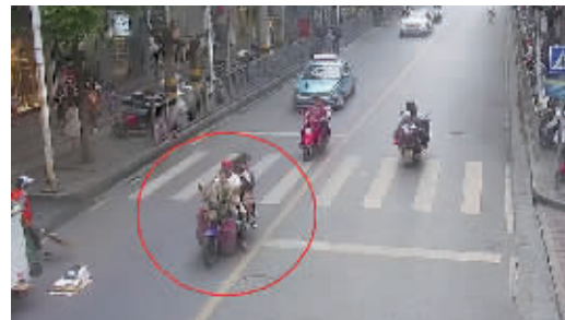
6月1日下午，湘西永顺一名家长骑摩托车载着5名孩子。 视频截图