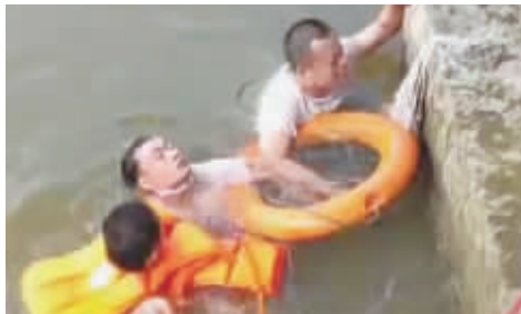
救援现场。视频截图