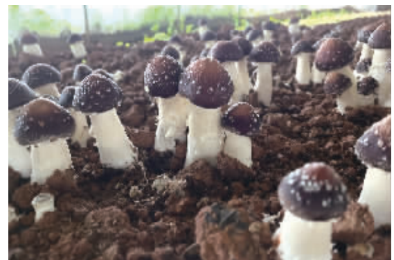
高桥镇用辣椒秸秆种蘑菇获丰收。