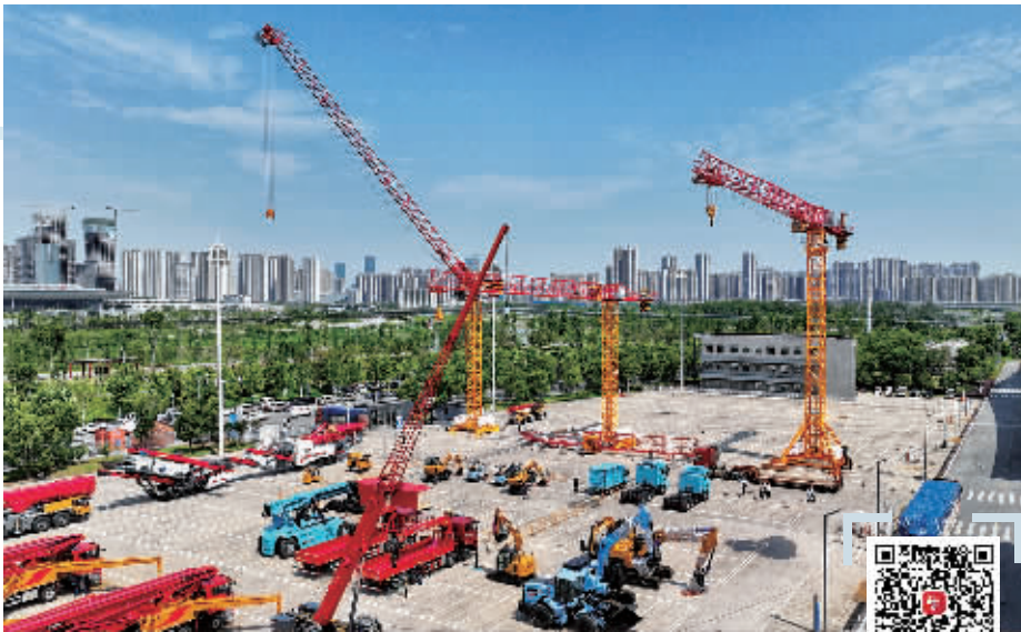
5月9日,第三届长沙国际工程机械展开启室内集中布展,室外展馆超九成设备已进场。