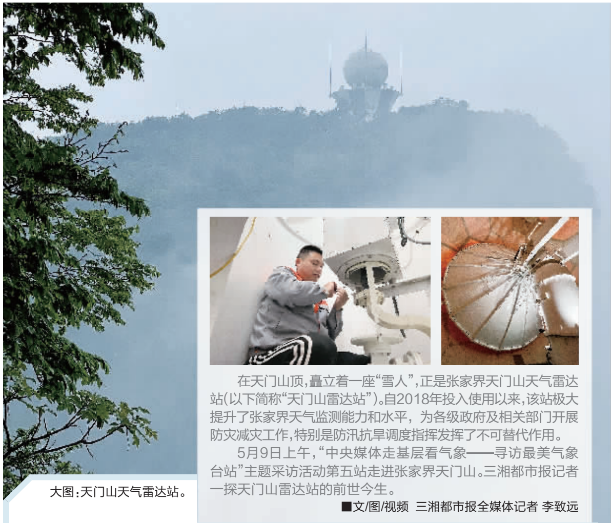
大图：天门山天气雷达站。