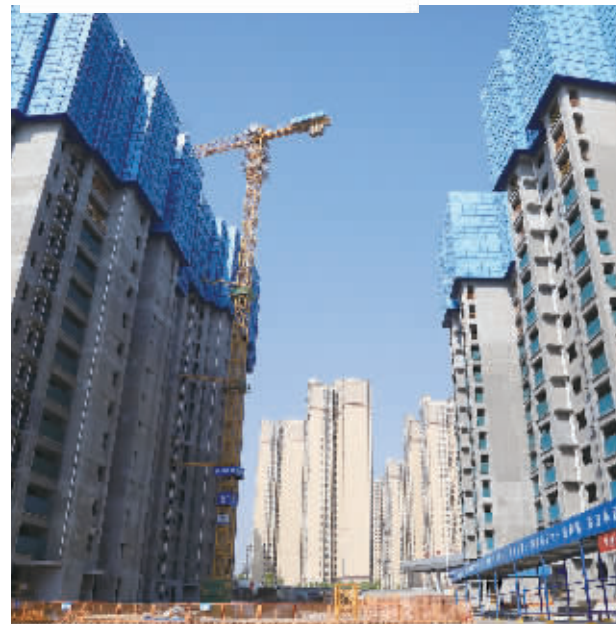
坪塘北片保障性住房项目二期现场。