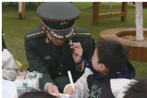
▲ 幼童比对着解放军的帽徽画画。 ▶ 幼童与解放军老师一起画雷锋。