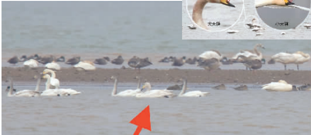
“混”在小天鹅群中的大天鹅。