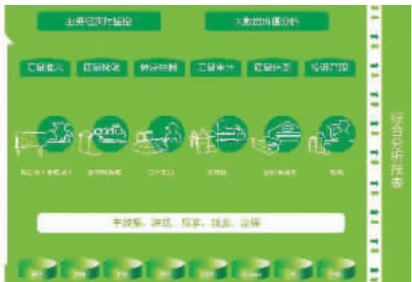
质量信息化综合管理平台示意图。

面向未来,蒙牛将持续深入运用数字化、物联网技术,打造“联通”“赋能”“共赢”为主题的“智慧质量”发展蓝图,将数字化战略持续向纵深推进,助力2025年实现“再创一个新蒙牛”战略,振兴中国乳业,让消费者时刻可以畅享一杯世界品质好奶,助力建设健康中国。