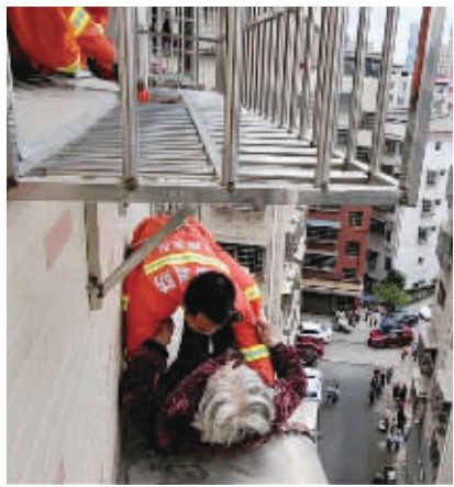
10月9日, 永州冷水滩消防员解救坠楼老人。