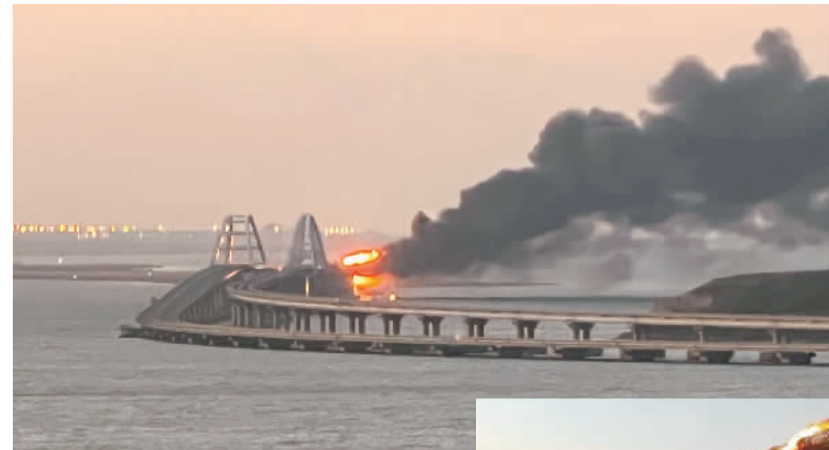
10月8日拍摄的照片显示的是克里米亚大桥起火现场。