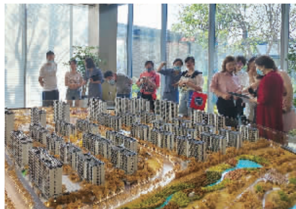
在长沙一项目营销中心，有不少市民正在看房。