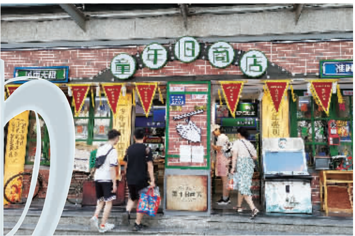
长沙街头的一家怀旧商店。

贩卖情怀的商家不仅限于此，在五一广场、泊富国际广场等人流集中的商业区，也有类似商店，主题布置、环境和服务都与“80后”、“90后”的成长经历有关。