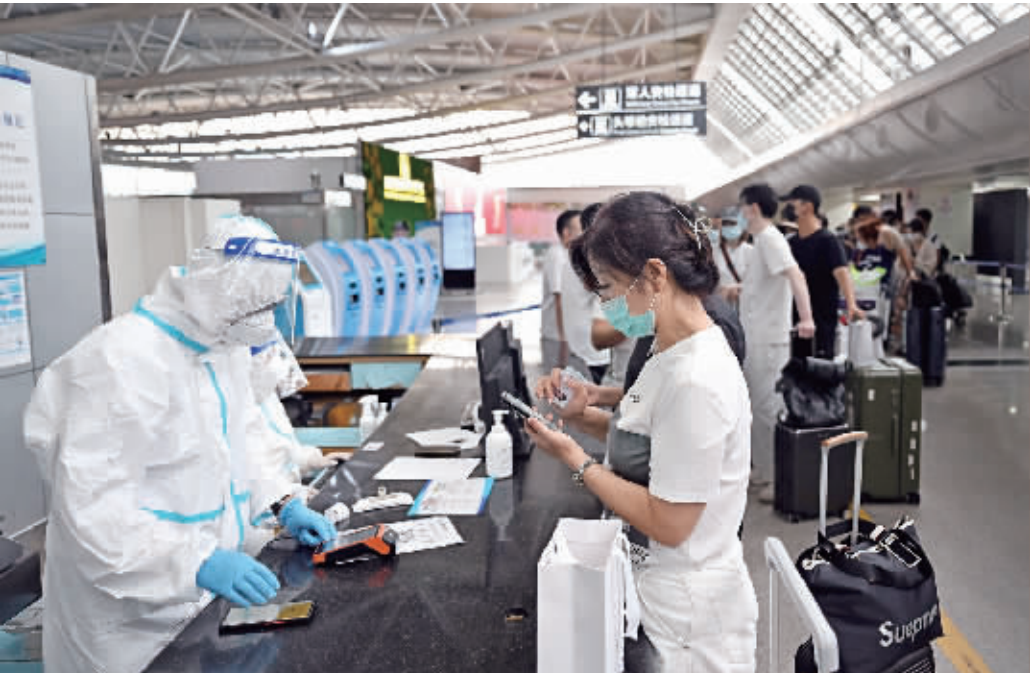
8月9日，滞留三亚的游客在三亚凤凰国际机场办理登机手续。