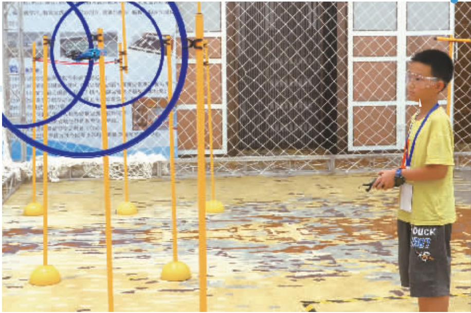
7月21日,第六届全国青少年无人机大赛湖南省赛在长沙举行。“小飞手”在赛场上专注地操纵无人机。

下一步,我省将建立高额医疗费用支出筛查预警机制,将监测对象等困难群众累计自负费用超过7000元、其他参保居民超过20000元的相关人员信息,及时推送给乡村振兴局、民政部门核查,落实帮扶措施;落实待遇清单制度,研究出台《湖南省职工基本医疗保险办法》《湖南省城乡居民基本医疗保险办法》。 今年,我省将全面建成职工医保门诊保障机制,各市州将在8月底前出台实施细则,12月底前实现门诊有报销,2023年1月1日起实施个人账户改革;长株潭争取10月左右率先启动实施改革。 全省将实施阶段性缓缴职工医保费政策,全省除3个市因统筹基金累计结存可支付月数小于6个月不实施外,其他地区自7月起对中小微企业等参保单位“免申即享”缓缴3个月职工医保费。继续深化医保支付方式改革,湘潭、郴州、常德、益阳、邵阳5个试点城市将扩大改革覆盖面,确保2023年1月启动第一批DIP实际付费;制定省级新增中药饮片目录,计划在国家药品目录基础上新增中药饮片551种;计划将800余种医疗机构制剂纳入目录管理。 值得关注的是,目前我省正在积极推动国采第七批药品和第三批耗材中选结果执行,加快四川口腔种植体、福建心脏电生理、江西肝功能生化、浙江导引导丝导引导管、陕西心脏瓣膜、吉林弹环圈等6个省际联盟集采省内落地进度;建立医药价格指数发布制度,按时编制发布药品采购价格和医疗服务价格指数。 ■全媒体记者 李琪 实习生 廖莹 孙昕 杨祎莎 通讯员 欧阳振华