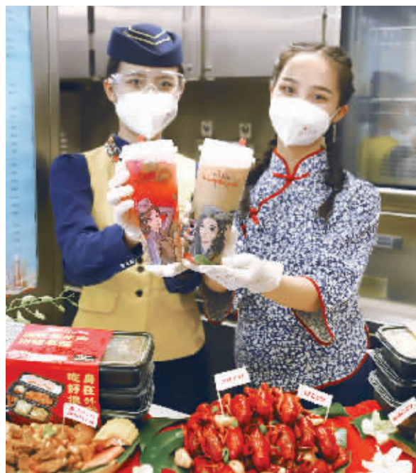
常益长高铁列车上的“湘”味餐食。