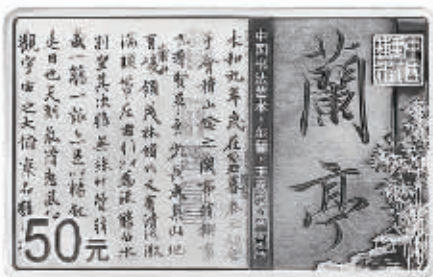
150克长方形精制银质纪念币背面图案