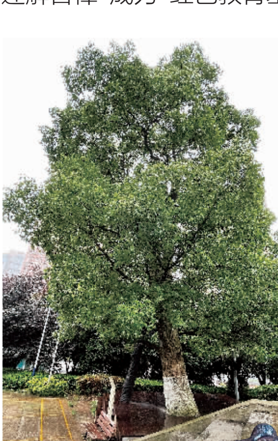
▲5月24日,长沙市芙蓉区东屯渡大桥西岸的“迎解古樟”,已有210余年树龄。

现在,这棵树龄210余年的古樟树,成为了马王堆街道新桥新村社区的“红色教育基地”。党员、群众、学生、青年志愿者等常常围坐樟树下,在解放广场上听党史故事,忆红色往昔,谈为民服务。当年百姓为解放军搭建浮桥的地方,早已建起了跨河大桥,结束了两岸群众摆渡的历史。