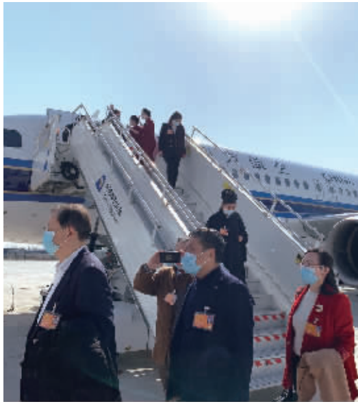
3月3日下午,出席全国政协十三届五次会议的住湘全国政协委员抵达北京。

3月3日下午,出席十三届全国人大五次会议的湖南代表团在驻地举行第一次全体会议,省委书记、省人大常委会主任张庆伟主持会议。