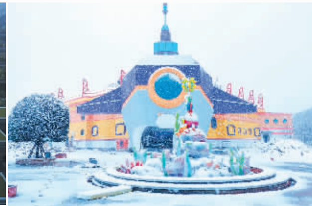
欢乐海洋项目外观