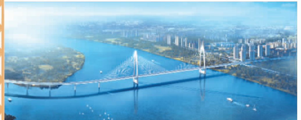
长沙兴联路大通道项目效果图