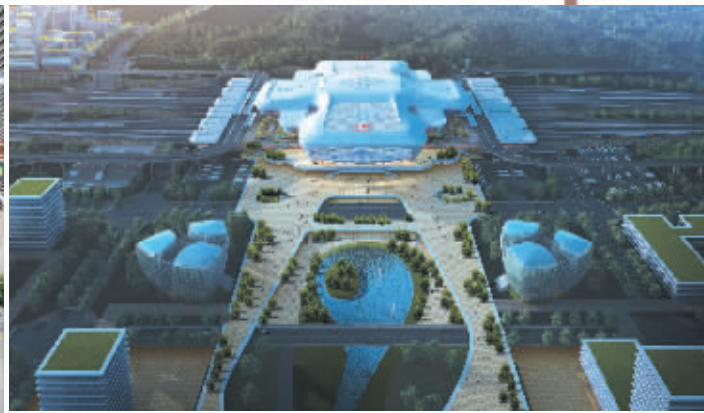
长沙高铁西站效果图