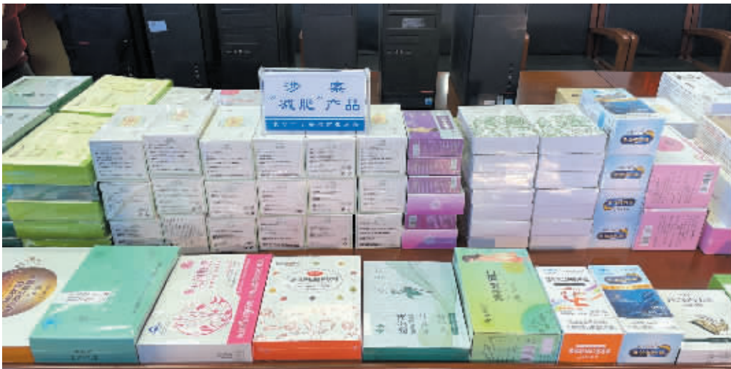
被长沙市公安局雨花分局警方缴获的“减肥产品”。

对此，也有网友质疑，这种天桥实用性怎样？背后安全性能否得到保证？会不会浪费电？1月12日，记者进行了走访核实。