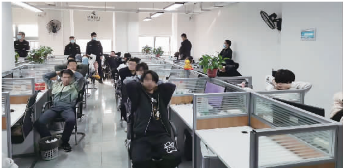
抓捕现场。