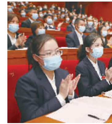
党代会报告振奋人心，赢得代表们一次次掌声。