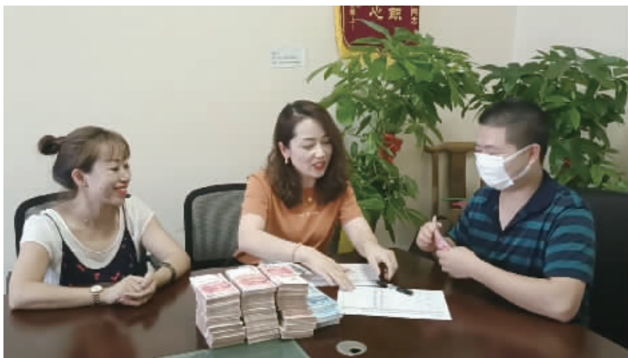
9月15日，在长沙市芙蓉区建安新商汇大厦业委会办公室，业主领完中秋红包后，笑得更灿烂了。