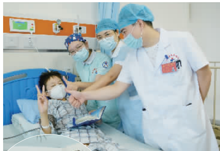
▲9月15日，恒恒转入普通病房，他和医护们一起重温“打怪”时光。