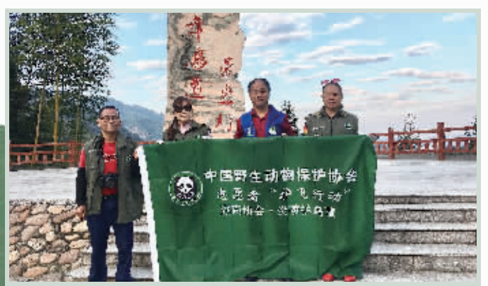
志愿者开展护飞行动。

立民间护鸟队伍,共同保护候鸟迁徙。眼下,炎陵县林业局也进入了“特护时期”,在下村乡牛头坳候鸟保护站安排林业局工作人员、森林公安、下村乡工作人员坚持100天全天候、全方位巡护值守。同时还和周边县建立联防机制,严厉打击非法猎捕、毒杀、收购候鸟的行为。据了解,自2012年开始,我省在环洞庭湖区、雪峰山脉和罗霄山脉、武陵山脉的候鸟迁徙重点区建立了43个候鸟保护站,实现候鸟保护重点地区全覆盖,并在候鸟迁飞季全程实行24小时值守巡护。我省各地还积极组织生态护林员,制止、查处非法猎捕候鸟行为,大范围开展清网、清套、清爽和清除毒饵等活动。长期持续的巡护打击,促使省内打鸟等破坏鸟类资源的非法行为大为减少,历史形成的打鸟点都已经转为“护鸟点”“观鸟点”。此外,全省共建立各类各级