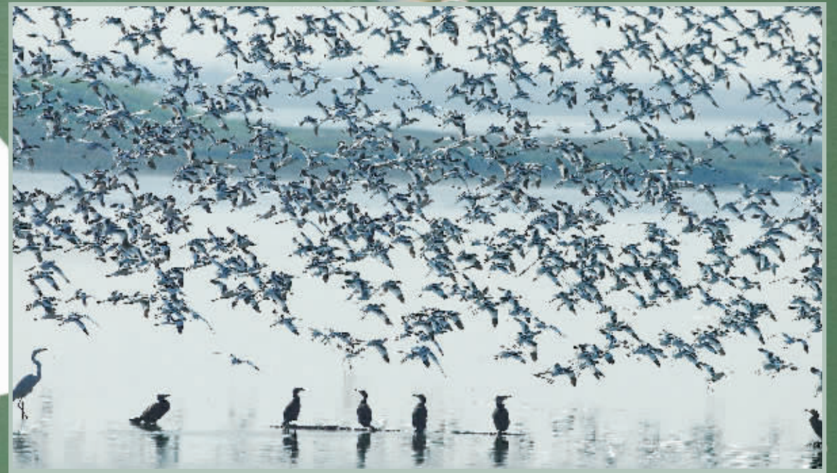
一群中华秋沙鸭掠过水面。

水浸皆湖、水落为洲。由湘、资、沅、澧和长江水汇流注入,位于益阳沅江市附近的南洞庭湖,其湿地面貌随水量不同而显著变化。南洞庭湖是一个大自然迷宫,又是一个生物遗传基因库。2.4万公顷的湖洲芦苇,是世界上最大的苇荻群落,也成为鸟类的最佳栖息地,可以观察到白鹤、白头鹤、中华秋沙鸭等国家一级保护动物。当然,长沙附近也有很多观鸟的好地方。比如,松雅湖、洋湖、梅溪湖、干龙湖、大泽湖以及浏阳的长兴湖等等。