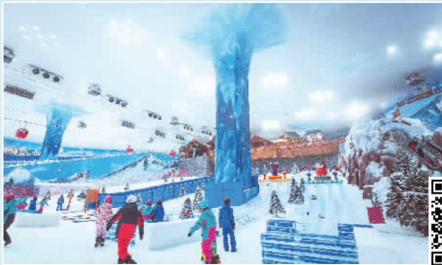
在湘江欢乐城欢乐雪域内，市民正在享受清凉夏日。

随着“带动三亿人参与冰雪运动”工作不断推进，冰雪运动产业正被纳入湖南省加快发展健身休闲产业的总体规划。根据《湖南省全民健身实施计划（2016-2020年）》的有关布局，湖南省正在具备条件的地区建设冰世界冬奥文化广场，并将有计划地建设一批公共滑冰馆、室外滑冰场和滑雪场等冰雪运动场地。新华社便在有关报道中指出，湖南省冰雪场馆全年接待人数40万左右，单次体验式的周末休闲游模式为主，冰雪运动仍处于市场培育期。