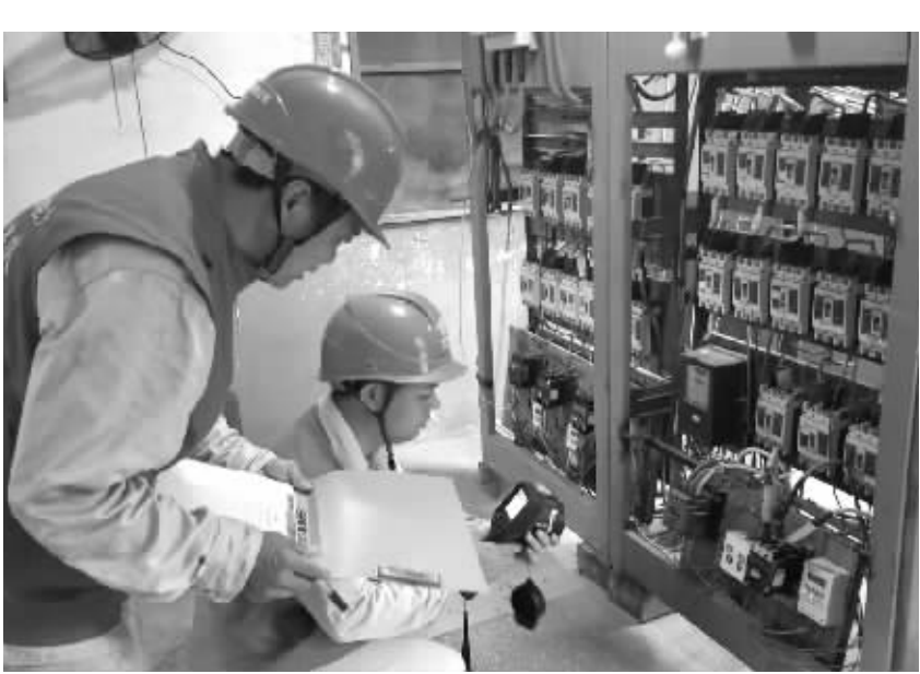
随着6月份高温天气来临,国网怀化供电公司党员服务队主动上门为客户检查用电设施,为夏季高峰用电消除设备隐患。