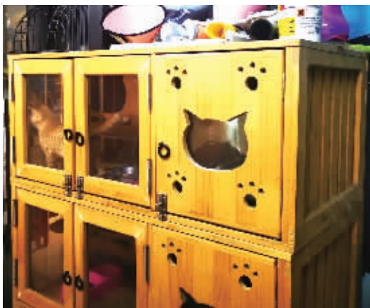
位于长沙市古曲路的无忧宠物店，寄养了不少萌宠。

“猫寄养一天标准间是88元，是一半玻璃，一半木质的房子。豪华间为198元，是全玻璃的柜子，狗的寄养价格则从58元到98元不等。这个‘五一’的前三天就已经一房难求，我们还特意增加了房间。”位于岳麓区的喵享家私致宠物店的工作人员表示，去年疫情开始后，这次“五一”是需求最火爆的一次。