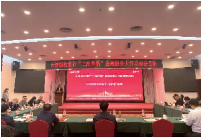
长沙银行践行“三高四新”金融服务大行动走进岳阳市活动现场。