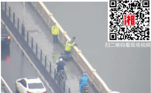
4月14日，长沙橘子洲大桥，交警抱住要跳桥的小伙。（视频截图）