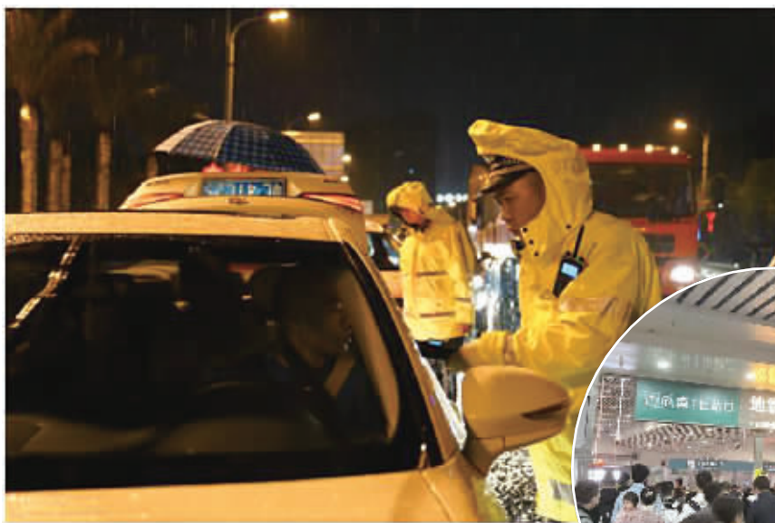
◀清明节假期，全省公安交警部门日均出动警力17995人次、警车5236台次，共查获重点交通违法行为12316起。