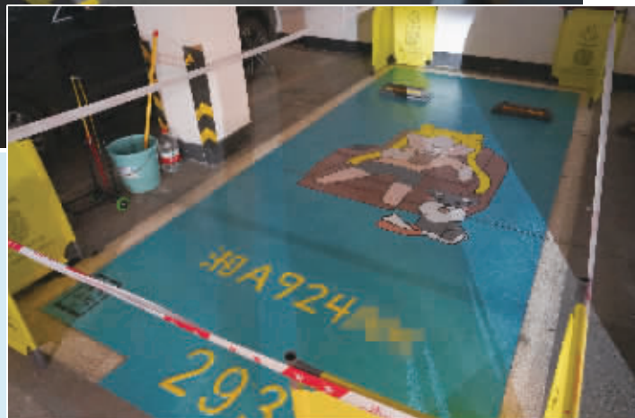
►团队手绘的漫画车位。