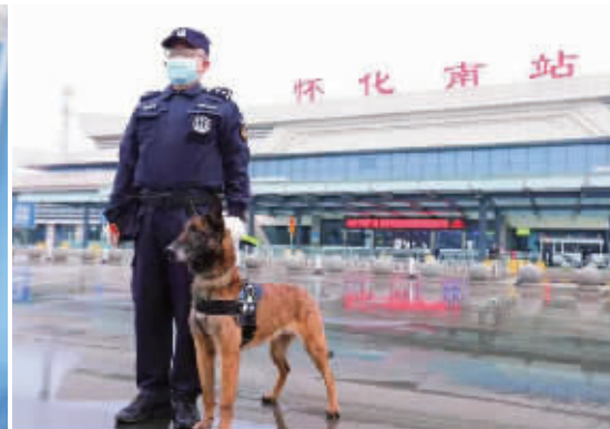
春运期间，怀化南站，警犬乐乐坚守在安保岗位上。在2020年全国铁路公安机关警犬搜爆比赛中，它曾获得“四项全能”第一。