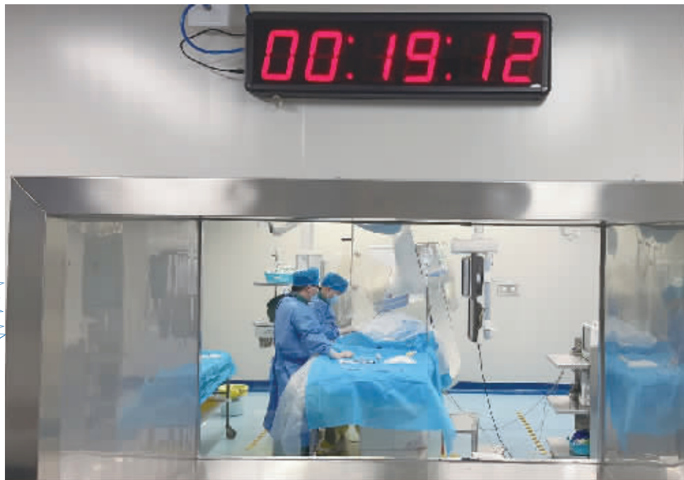
1月1日零时19分,郴州市第一人民医院使用国家组织的冠脉支架集中带量采购中选产品,成功为患者实施冠心病介入手术治疗。

手术进展顺利,两位“跨年”患者也成为新年首批享受国家医改福利的人。这标志着今后湖南患者可在具备手术开展条件的医疗机构,使用百元级低价冠脉支架。