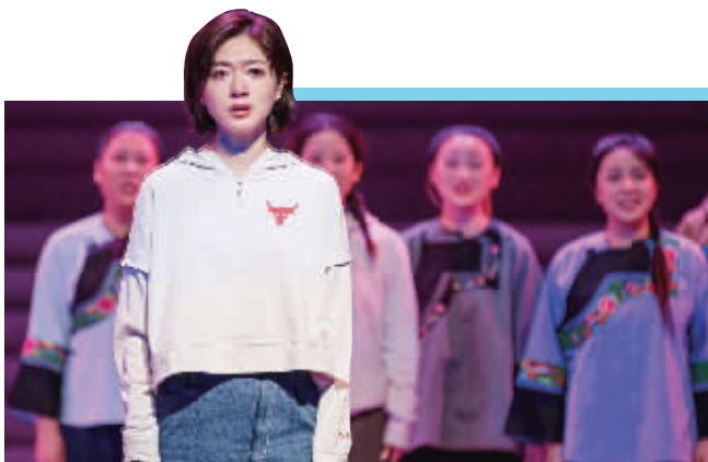
9月29日,《大地颂歌》首轮公演,万茜剧照。