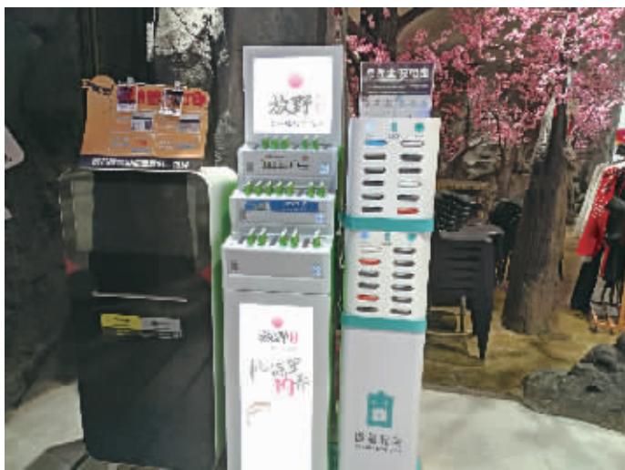
9月18日,长沙一家商场内摆放的共享充电宝。

“初期的共享经济项目通过资本的助推加快了对市场的探索,但同时也导致了其商业模式的不成熟,尽管共享经济平台不断尝试新的盈利方式,但目前依旧未解决规模盈利的难题。”网经社-电子商务研究中心共享经济分析师陈礼腾认为,通过涨价来提高收益,成为共享经济产品最直接有效的手段。