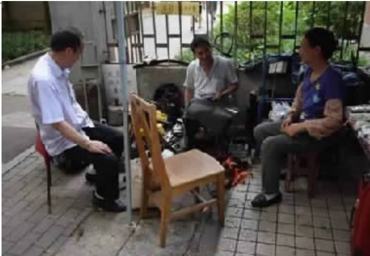
李大叔与妻子在中大经营修鞋摊已三十多年。