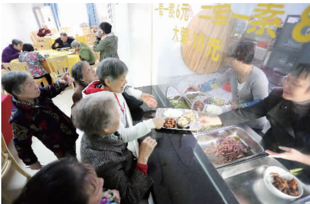
11月2日,衡阳市雁峰区光辉社区日间照料中心,老人们在开心地吃午餐。今年来,雁峰区积极探索多种养老模式,先后建成社区日间照料中心2家、城乡养老服务示范点2个、农村幸福院8家。目前,社区日间照料中心的老人可免费享受娱乐、午休以及低价午餐、晚餐。