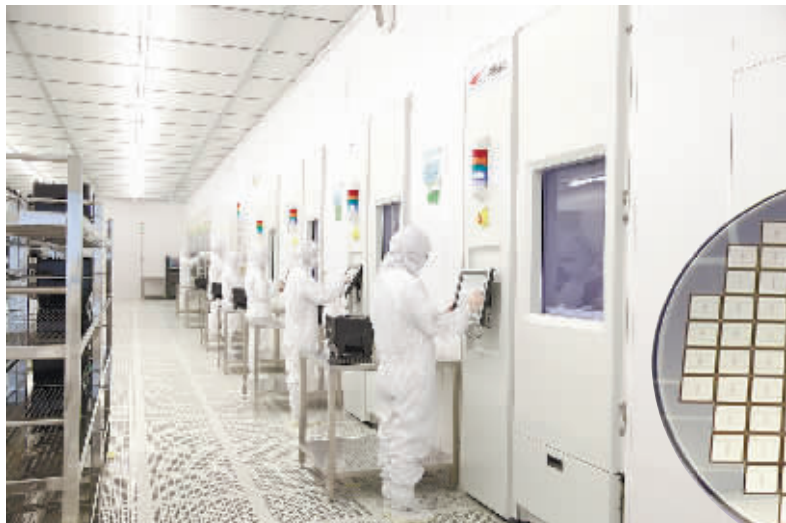
▲中国南车株洲所大功率IGBT产业化基地工艺车间。

▼一个8英寸IGBT芯片的“诞生”，至少需要2个月以上、历经200多道工序、由数万个“细胞”完成。